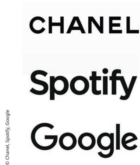
Logos mit Serifenlosen Schriften

Arial, Helvetica, Futura, Avenir, Satoshi